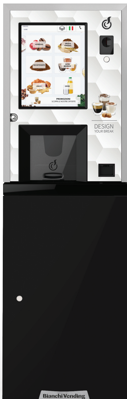
LEI250 TOUCH15" + MUEBLE + KIT ADHESIVO CON GRÁFICO "DESIGN YOUR BREAK" (OPCIONAL)